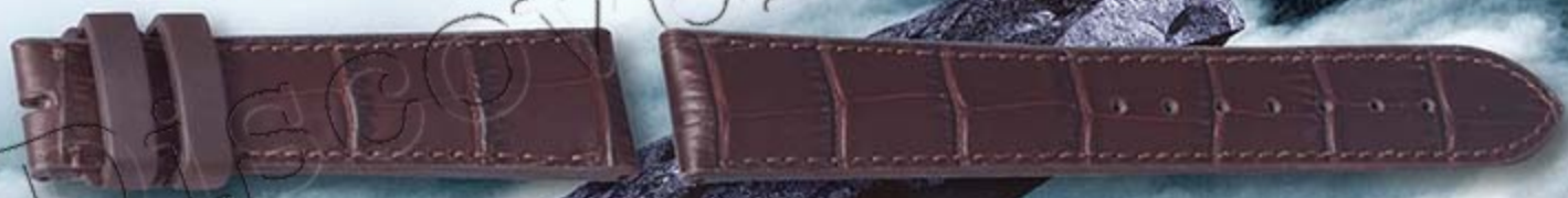
咖啡色橡胶带底, 面贴真牛皮