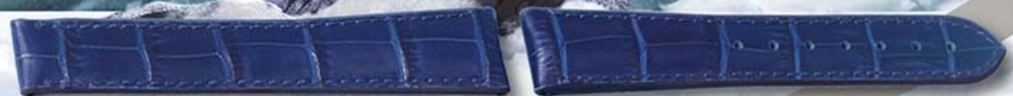
宝蓝色橡胶带底, 面贴真牛皮