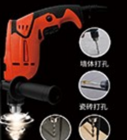
220V 冲击电钻工具套装