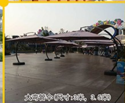
大弯管伞 (尺寸: 3米, 3.5米)