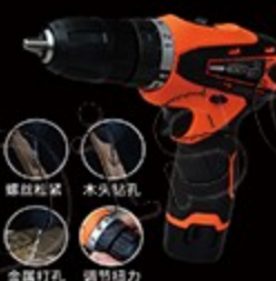
12V 自动螺丝刀工具套装