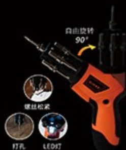
4.8V 自动螺丝刀工具套装