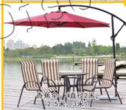
香蕉伞 (直径2米, 2.5米, 3米)