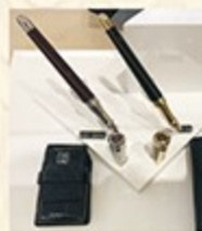
法国都彭宝珠笔、钢笔包