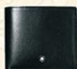
万宝龙大班系列 皮夹7164 零售价: ¥2550 优惠价: ¥1590