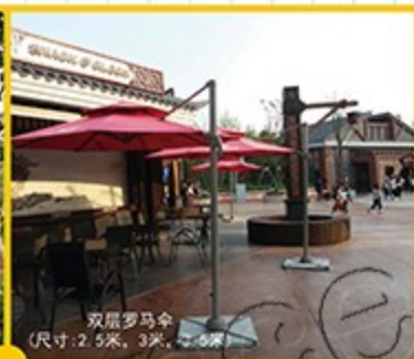
双层罗马伞 (尺寸: 2.5米, 3米, 3.5米)